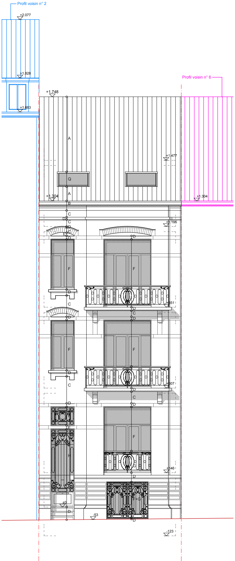
Façade à rue